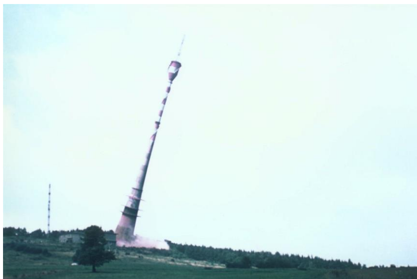
5) Odstřel prvního vysílače na Bukové hoře v září 1966