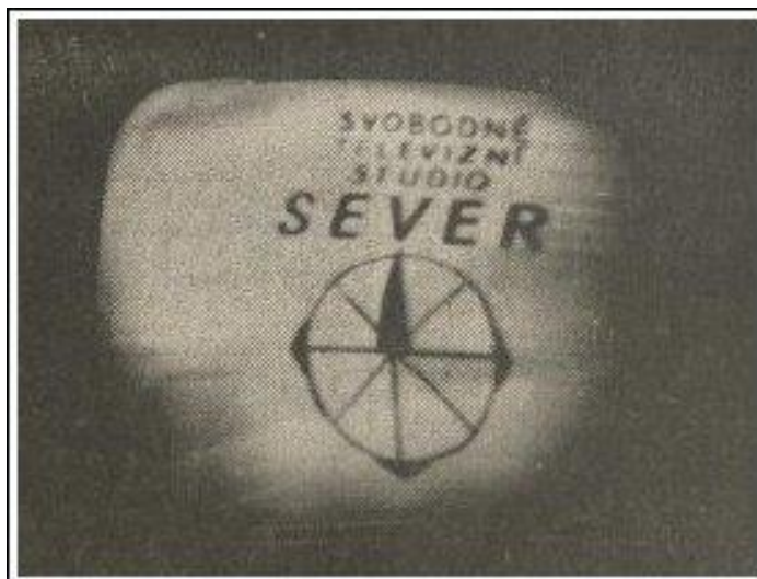
3) Logo Svobodného studia Sever.