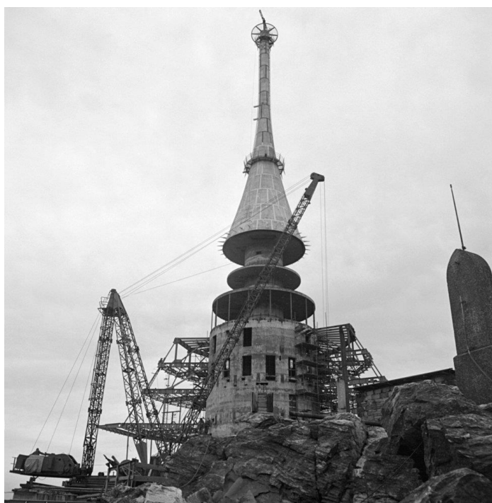
4) Stavba vysílače Sever odkud vysílalo svobodné studio.