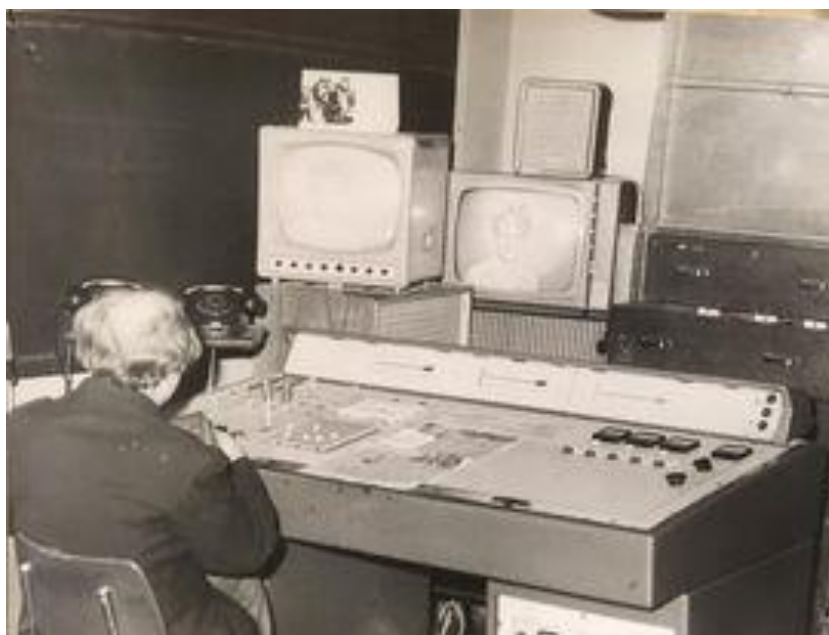
5) Řídicí středisko na Bukové hoře 60. léta